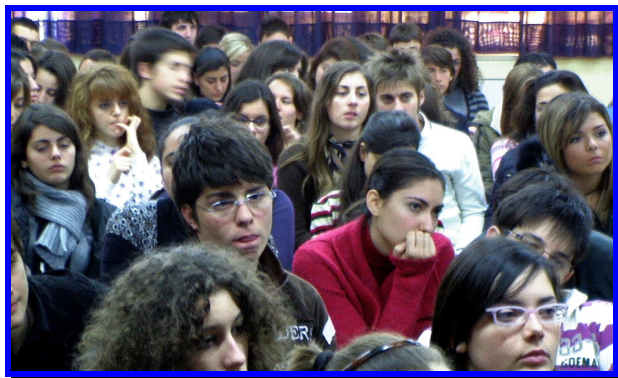
Palazzo Serra di Cassano, durante le fasi di presentazione

ATTI DEL SEMINARIO INTERNAZIONALE MAR COMUNE Palazzo Serra di Cassano - Napoli, 2-5 dicembre 2008